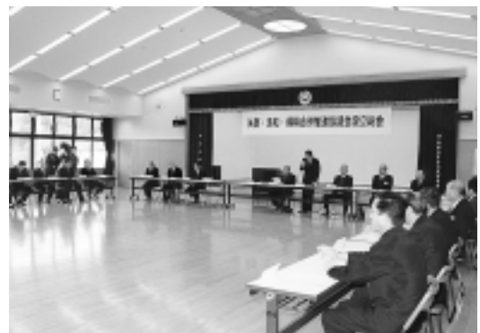
矢部町「千寿苑」で開催された合併推進協議会設立総会